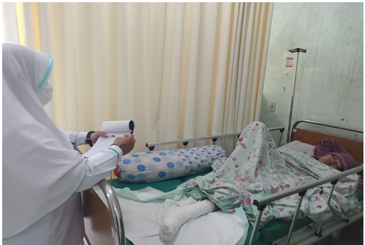
Gambar 5. wawancara dengan pasien