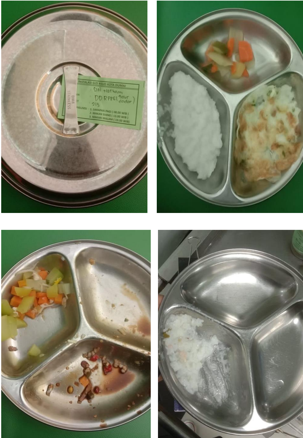
Gambar 3. Sisa Makanan