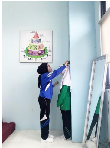
Gambar Pengukuran Tinggi Badan