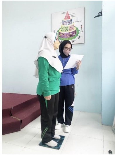
Gambar Penimbangan Berat Badan