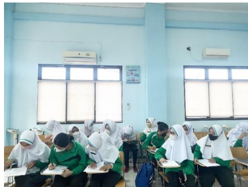
Gambar Pengisian Kuesioner