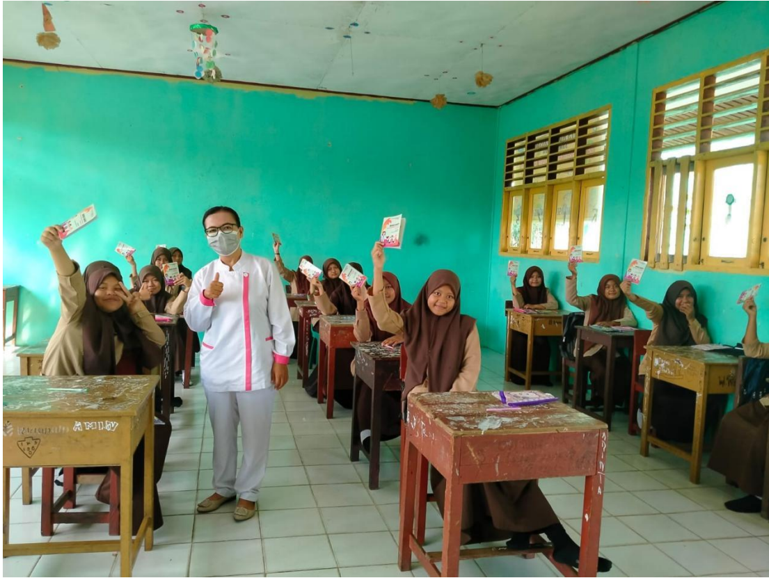
Keterangan : Siswi Menerima Buku Saku