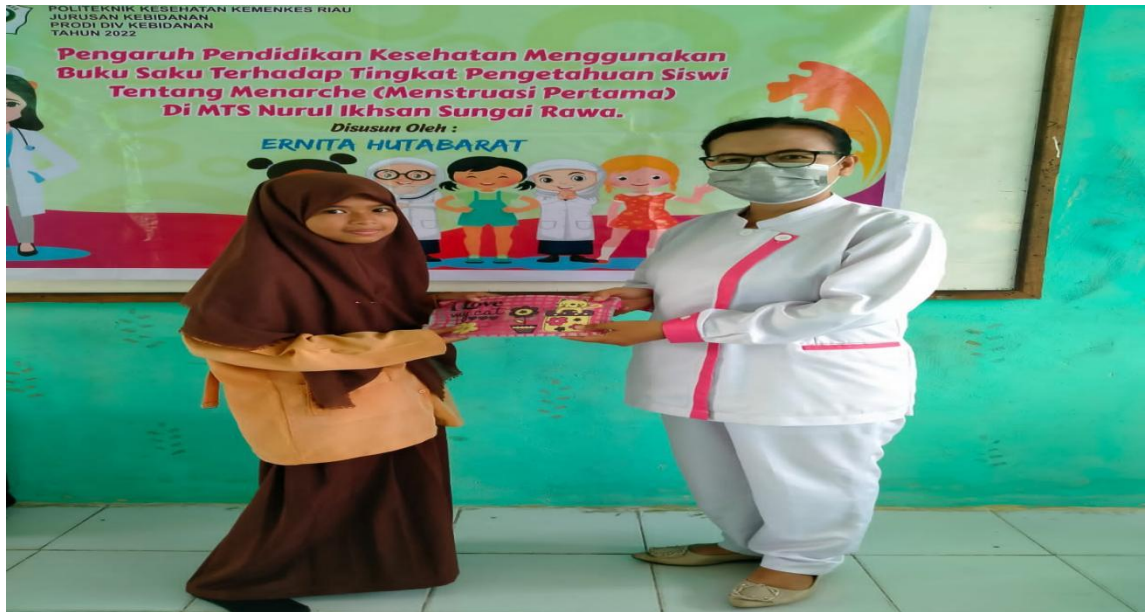
Keterangan : Peneliti memberikan hadiah kepada siswi yang mendapat nilai terbaik