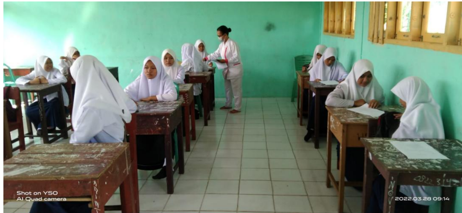
Keterangan : Memberikan lembar kuesioner pretest penelitian