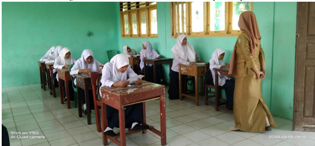
Keterangan : Siswi sedang mengisi lembar kuesioner pretes penelitian