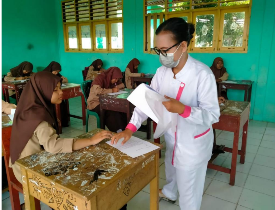
Keterangan : Memberikan kuesioner post test penelitian