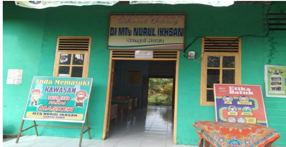
Keterangan : Lokasi Penelitian