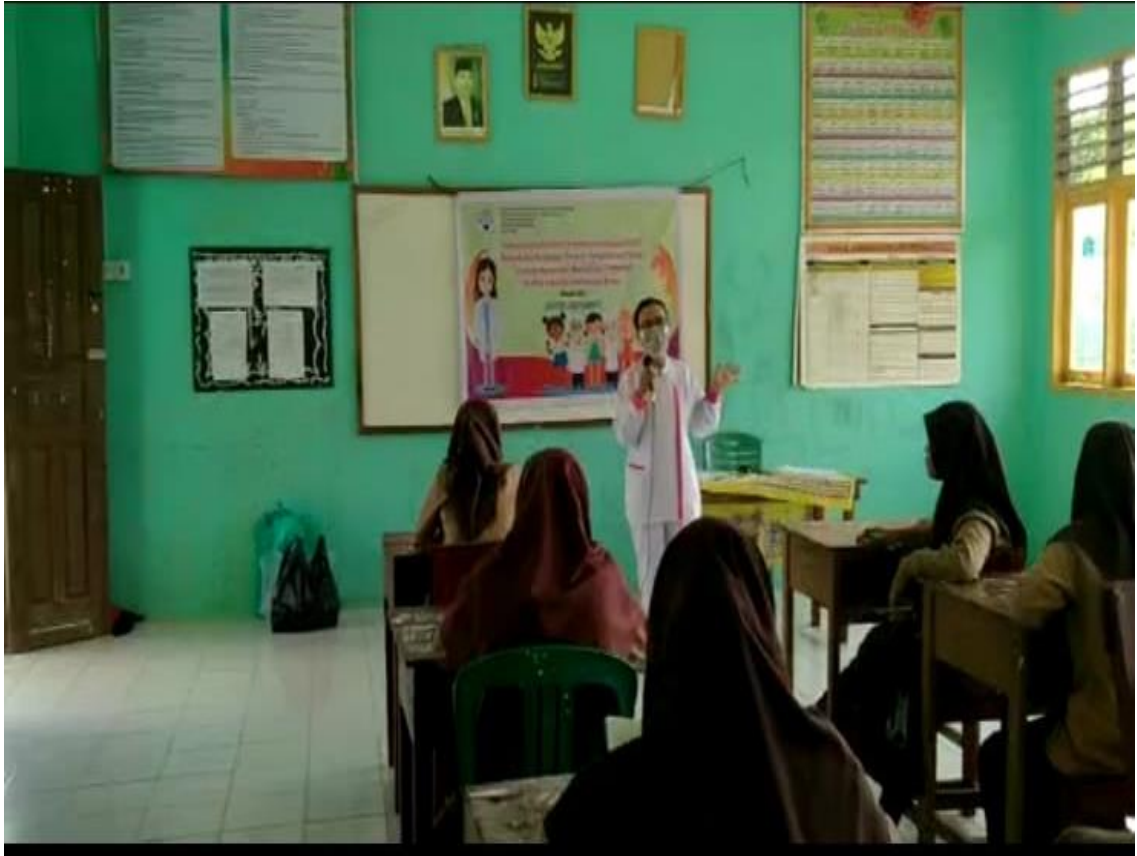
Keterangan : Memberikan pendidikan kesehatan menggunakan buku saku