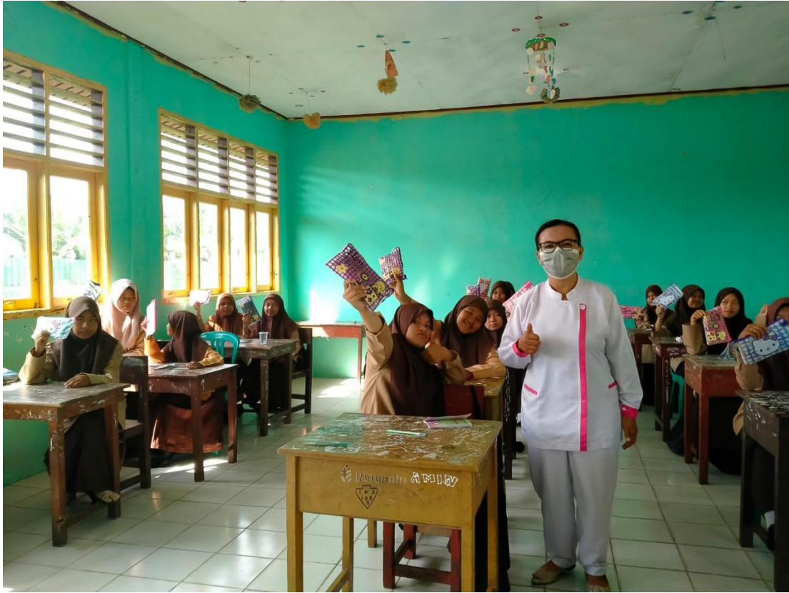
Keterangan : Peneliti memberikan kenang – kenangan kepada siswi