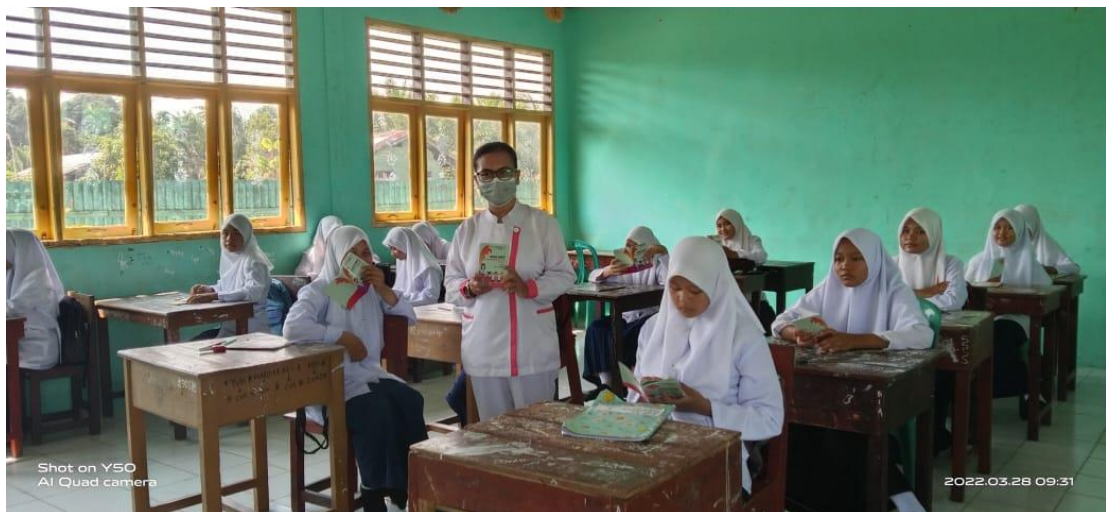
Keterangan : Memberikan Buku Saku