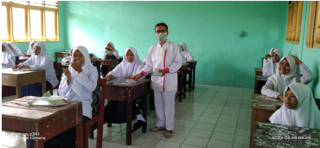
Keterangan : Memberikan Buku Saku setelah dilakukan pengisian kuesioner pretest penelitian