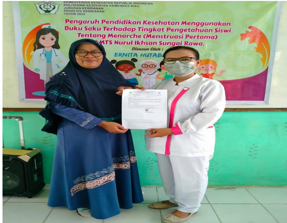
Keterangan : Memberikan surat izin kepada pihak sekolah dari poltekkes