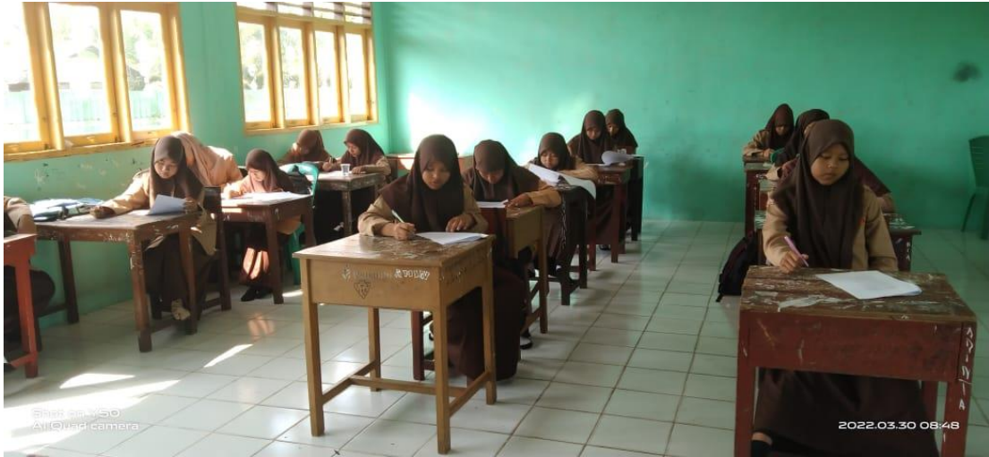
Keterangan : Pengisian Lembaran Kuesioner Postest Penelitian