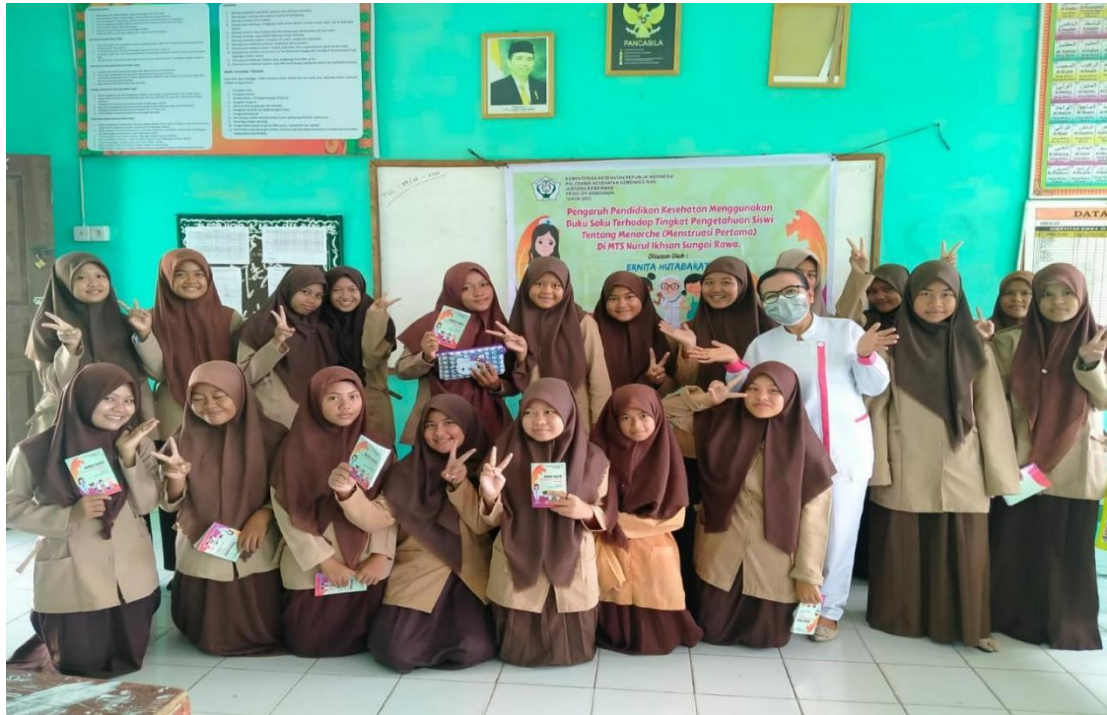
Keterangan ; Berfoto Bersama dengan siswi setelah penelitian post test selesai