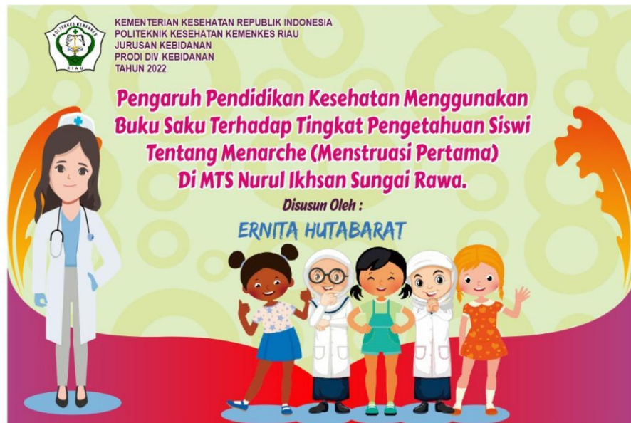
Keterangan : Buku saku penelitian