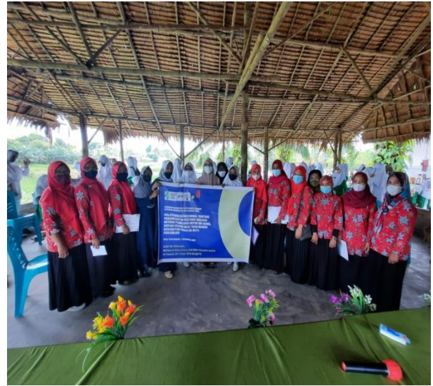
Gambar 2. Pelaksanaan Penyuluhan

Kegiatan ini diawali dengan pemetukan FGD dengan para kader desa Tuah negeri utnuyk menggali informasi awal kegiatan rutin yang dilakukan kader desa Tuah Negeri. Sebelumnya diukur terlebih dahulu tingkat pengetahuan kader tentang angka kejadian stunting serta pemanfaatan biji chia sebagai nutrisi tambahan ibu hamil yang mempengaruhi pertumbuhan fetus. Diperoleh bahwa pengetahuan kader desa Tuah Negeri belum cukup terkait pemanfaatan biji chia sebagai nutrisi tambahan untuk ibu hamil. Sehingga dilakukan kegiatan penyuluhan terhadap para kader yang berisi paparan informasi terkait dengan angka kejadian stunting serta pemanfaatan biji chia sebagai nutrisi tambahan ibu hamil yang mempengaruhi pertumbuhan fetus.