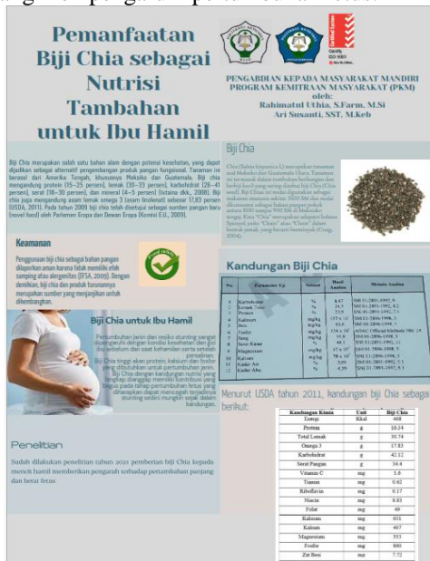
Gambar 1. Liflet yang diberikan kepada kader desa Tuah Negeri pada saat penyuluhan