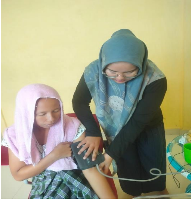
Kunjungan Kf 1: periksa tekanan darah