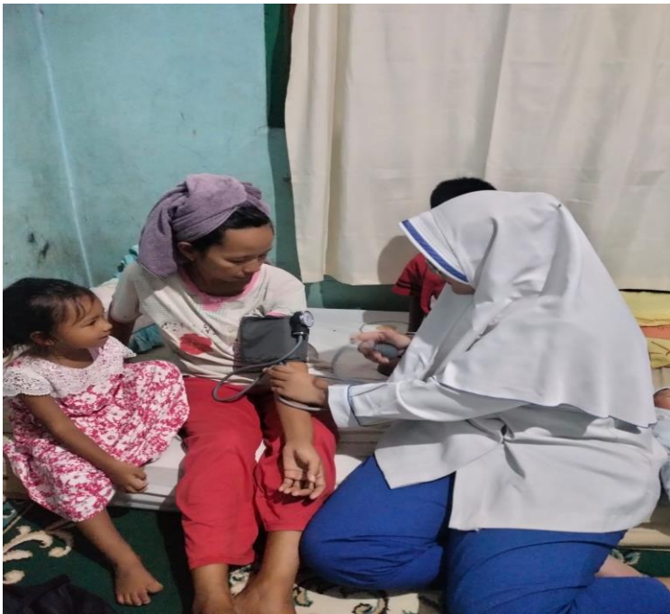
Kunjungan KF 2: Periksa tekanan darah