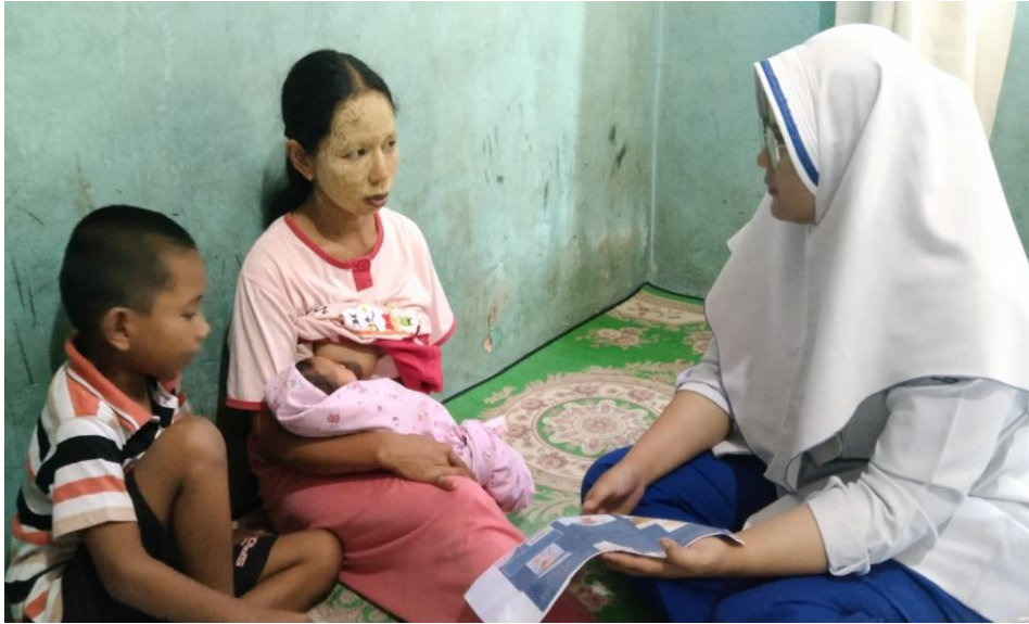
Kunjungan KF 2: Penkes Pemberian ASI Eksklusif