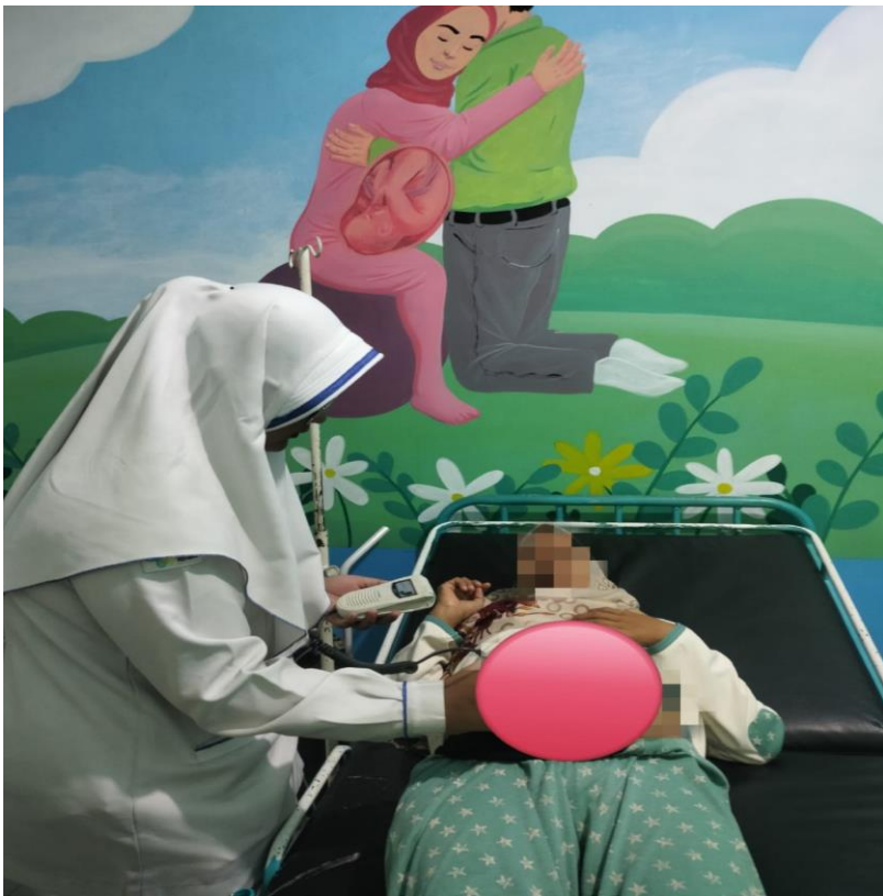
Kunjungan K3: Periksa DJJ