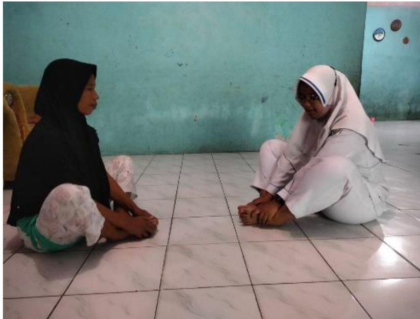
Melakukan senam hamil di rumah pasien