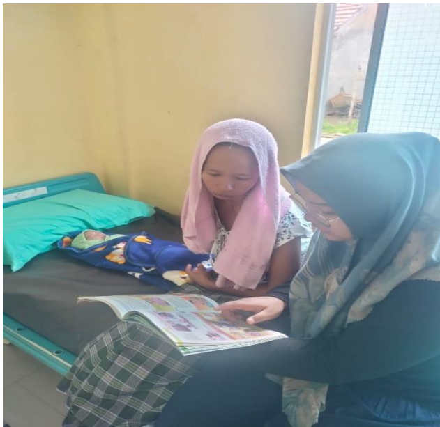
Kunjungan KF 1: penkes tentang tanda bahaya pada masa nifas