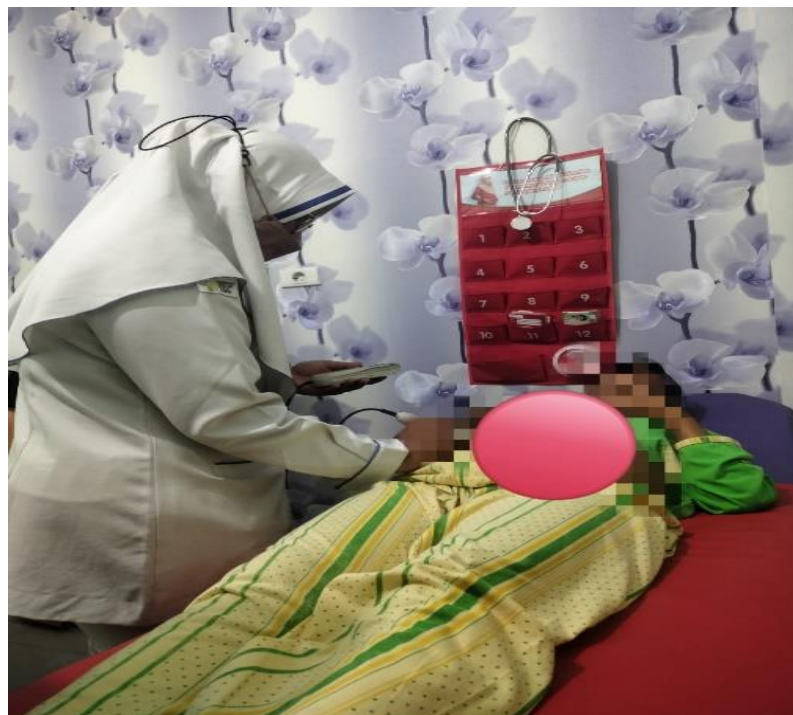
Kunjungan K1: Periksa DJJ