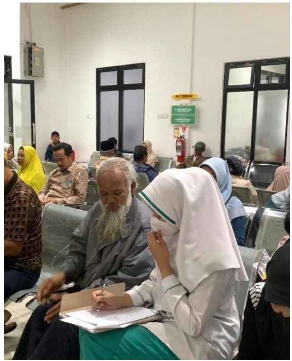
Wawancara pengetahuan dan kepatuhan diet DM