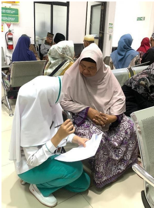
Mengisi Informed Consent