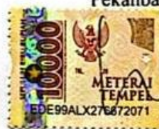
Hafidzah Haura Fitri