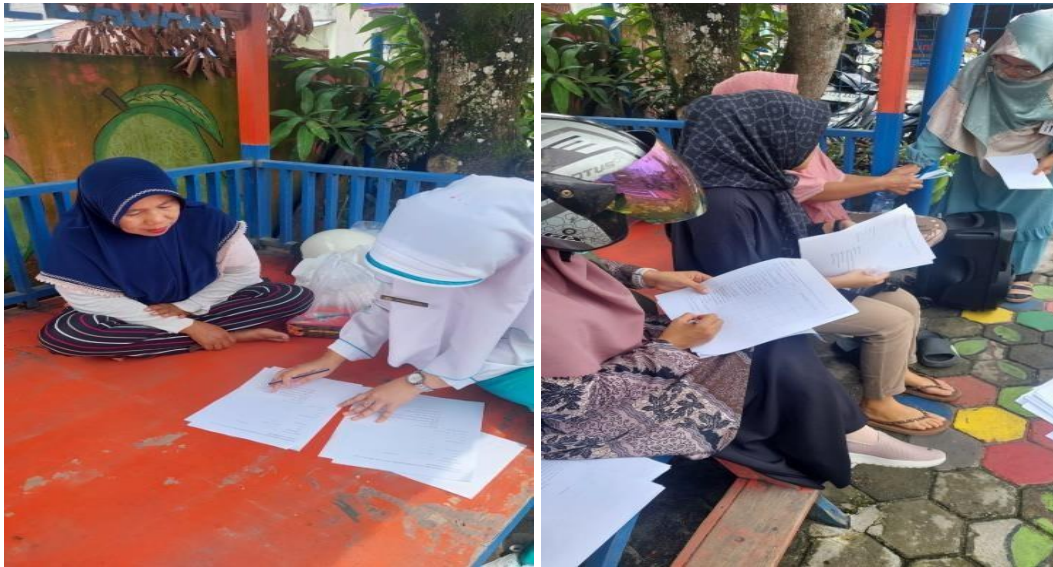
Pre Test Pengisian Kusioner (Pengetahuan)