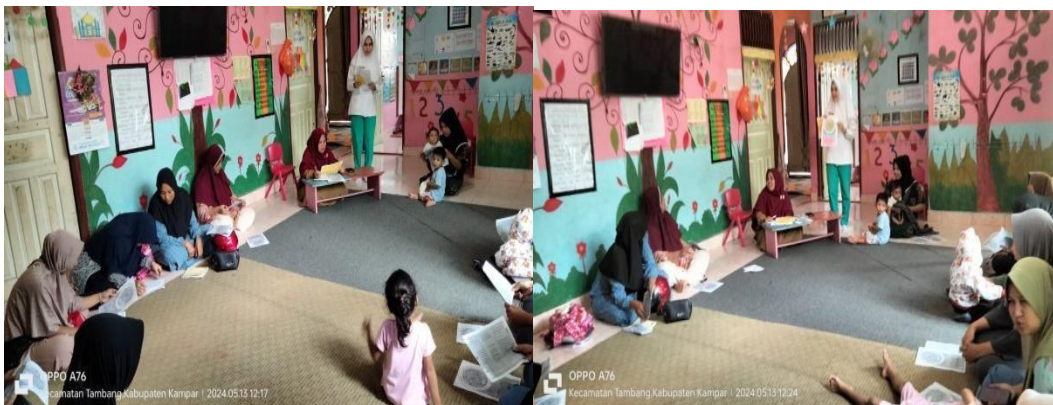
Post Test Pengisian Kusioner (Pengetahuan)